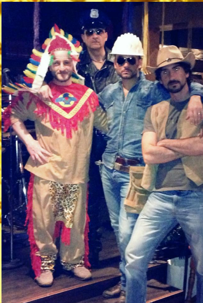
FRIZZANTE PARTY BAND , DOVE UNA COMPONENTE MOLTO IMPORTANTE NELLO SHOW E' IL COINVOLGIMENTO DEL PUBBLICO. DIVERTIMENTO MUSICALE A 360°